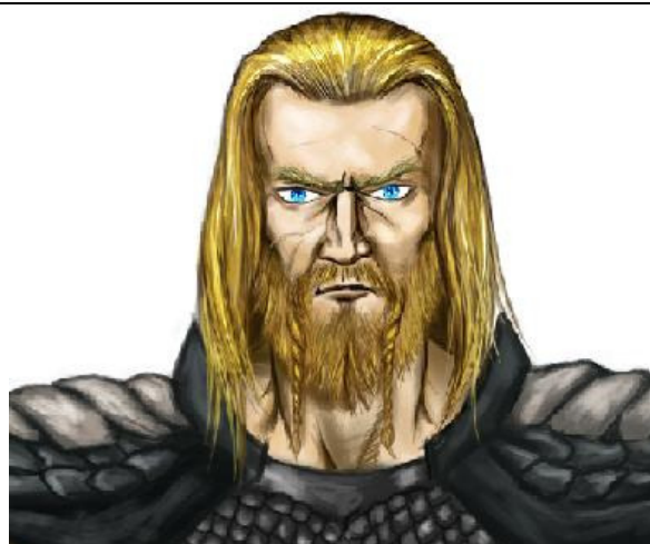
Yssel le Baron Pourpre

Le personnage d'Yssel reviendra dans les scénarios suivants (notamment dans Un dragon bien sûr de lui et le siège de Havrebusard ), ainsi que le personnage de Roddohan (dans Un dragon bien sûr de lui ). Les PJ seront amenés à les rencontrer dans les scénarios suivants de la campagne, aussi il serait bon qu'ils gardent de bonnes relations avec eux.